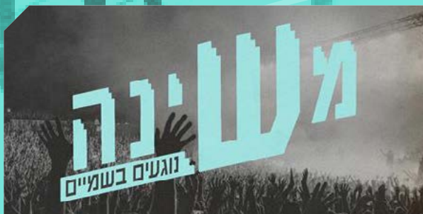
משינה 16/01/2025 בטרמינל חיפה