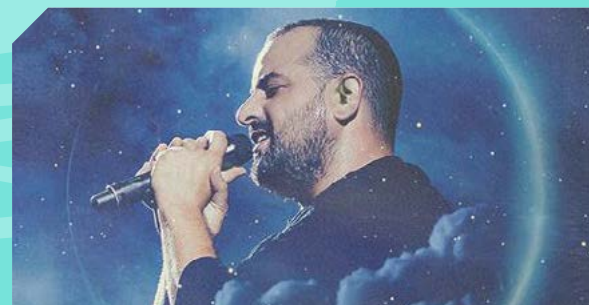
עקיבא 23/01/2025 האנגר 09 - עמק חפר