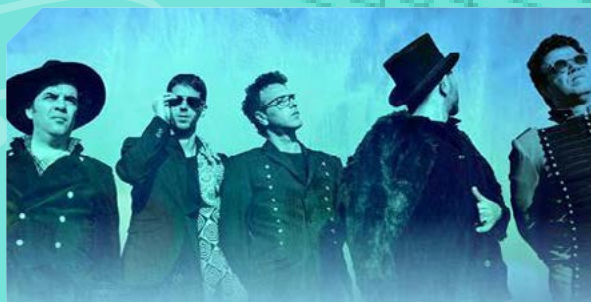
כנסיית השכל 30/01/2025 טרמינל חיפה