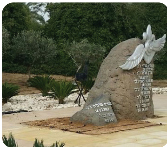
אנדרטת חללי גדוד ניצן