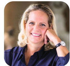
הברונית אריאן דה רוטשילד

עוד לפני הקמת המדינה ועד היום, קרן אדמונד דה רוטשילד ומשפחת רוטשילד עומדים זה שנים לצדה של מדינת ישראל, לצידה של קיסריה והרשויות השכנות לה. גם במשבר בריאותי וכלכלי זה, נרתמו קרן קיסריה, החברה לפיתוח קיסריה, מנהלת הישוב והמועצה האזורית לסייע לרשויות המקומיות השכנות ולבית החולים הלל יפה למאבק בנגיף ולמניעת התפשטות במרחב קיסריה ושכנותיה: